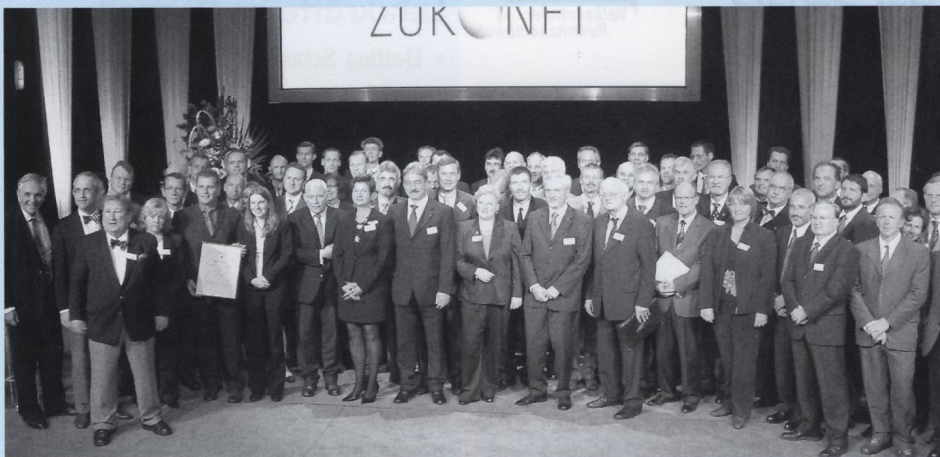
Gruppenbild mit Bürgermeister: Zum Abschluss des Festaktes stellten sich alle Vertreter der ausgezeichneten Kommunen dem Fotografen.