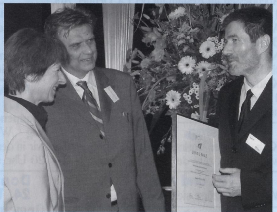
Foto: Die schweizerische Bundeskanzlerin Annemarie Huber-Hotz und der österreichische Sektionschef Magister Emmerich Bachmayer gratulieren Bürgermeister Jürgen Spahl zu dieser tollen Gemeindeleistung (weitere Informationen und Fotos dazu auf Seite 8).

Als Sieger im 7. Internationalen Speyerer Qualitätswettbewerb 2005 wurde unserer Gemeinde im österreichischen Linz für das Themenfeld „Haushalts- und Finanzmanagement“ die Auszeichnung überreicht.