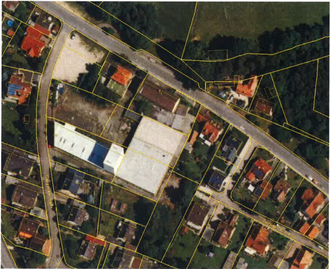
Luftbildkarte des Geltungsbereichs