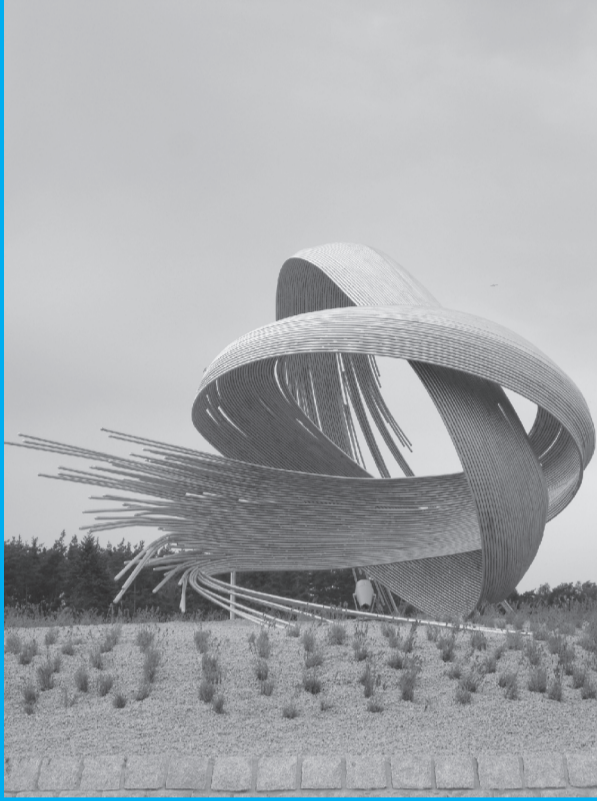
Schon am Ortseingang werden die Besucher kunstvoll begrüßt - mit dem „Großen Knoten“ an der Kreisstraße RH 1.

Folgen Sie einfach dem Kunstweg-Logo auf dem Rundweg. Sie können überall einsteigen!